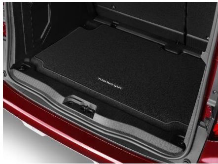
Mata bagażnika welurowa