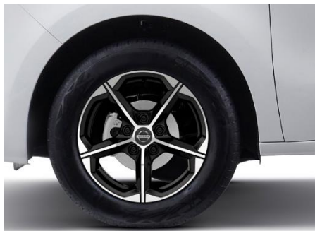
Felgi aluminiowe 16"