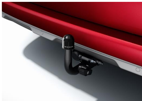
Hak holowniczy - zdejmowany